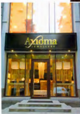
L'ARCHITETTO INTERNO: I I Q